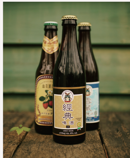
〈台灣啤酒〉草莓啤酒台灣限量版 Taiwan Beer Strawberry 原價 220

YUE YUE - THE BIRTHPLACE OF IDEAS - | MENU 06 ALCOHOL | ★ ILLUSTRATION / PHOTOGRAPH = HSINHUEI WU