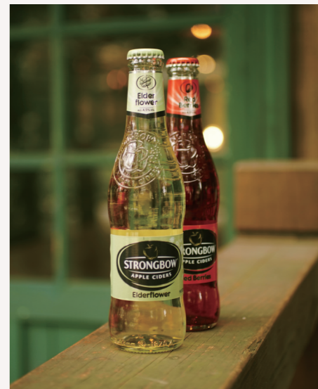
〈詩莊堡蘋果酒〉接骨木花 Strongbow Elder Flower 原價 150